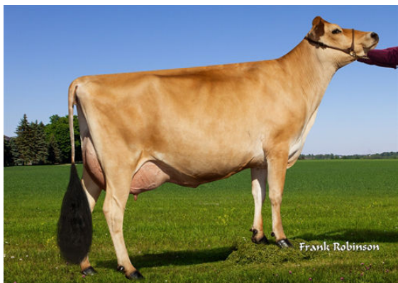
PROGENESIS MADISON- DAM

RIVER VALLEY HERITAGE {6} PROGENESIS MADISON EX-90%-3YR-USA JX RIVER VALLEY CHIEF {6} RACHELLES VICEROY LOUISE VG-88%-6YR-USA CDF VICEROY RACHELLES GENOMINATOR 7857